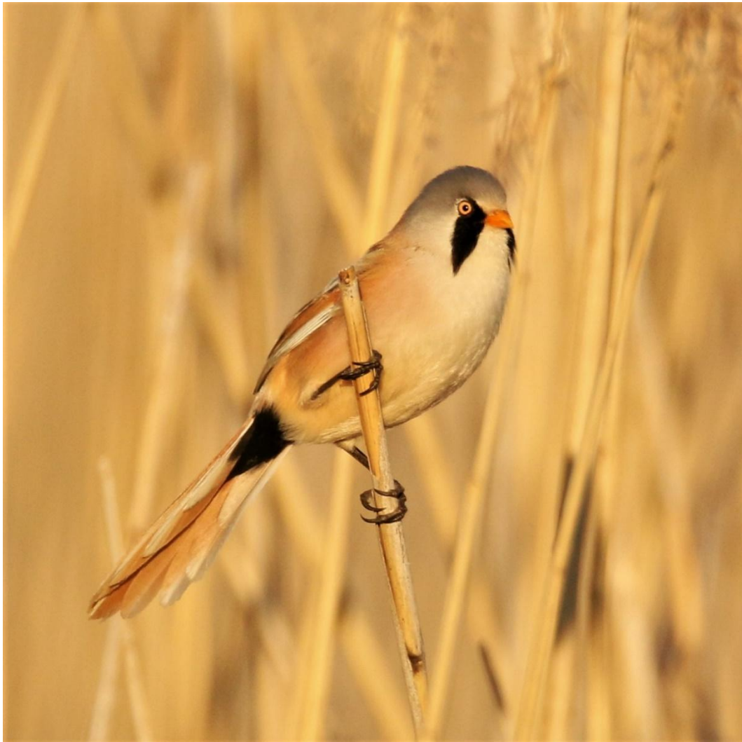
Skäggmes vid Strömsvik